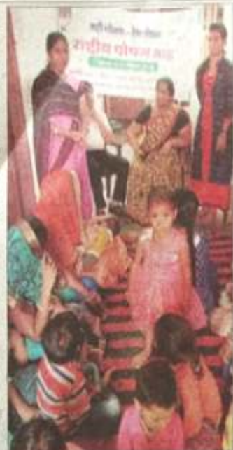
अंगनवाड़ी कार्यकर्ता बच्चों को पोषण जानकारी दे रहे हैं।