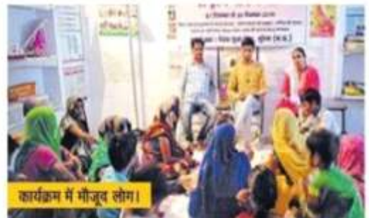
कार्यक्रम में मौजूद लोग।

परिचय न्यूज नेटवर्क patrika.com मुंबई। बच्चों में कुपोषण मिटाने के लिए आयोजित किए जा रहे राष्ट्रीय पोषण माह के तहत घर-घर जाकर जागरूकता अभियान चलाया जाएगा। इसके तहत सोमवार को संजय कॉलोनी स्थित आंगनवाड़ी केंद्र 167 पर कार्यक्रम का आयोजन किया गया। कार्यक्रम में नेहरू युवा केंद्र के