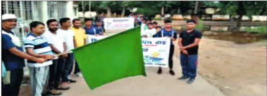
हरि इंडी दिग्दर्शक पदाधिकारी