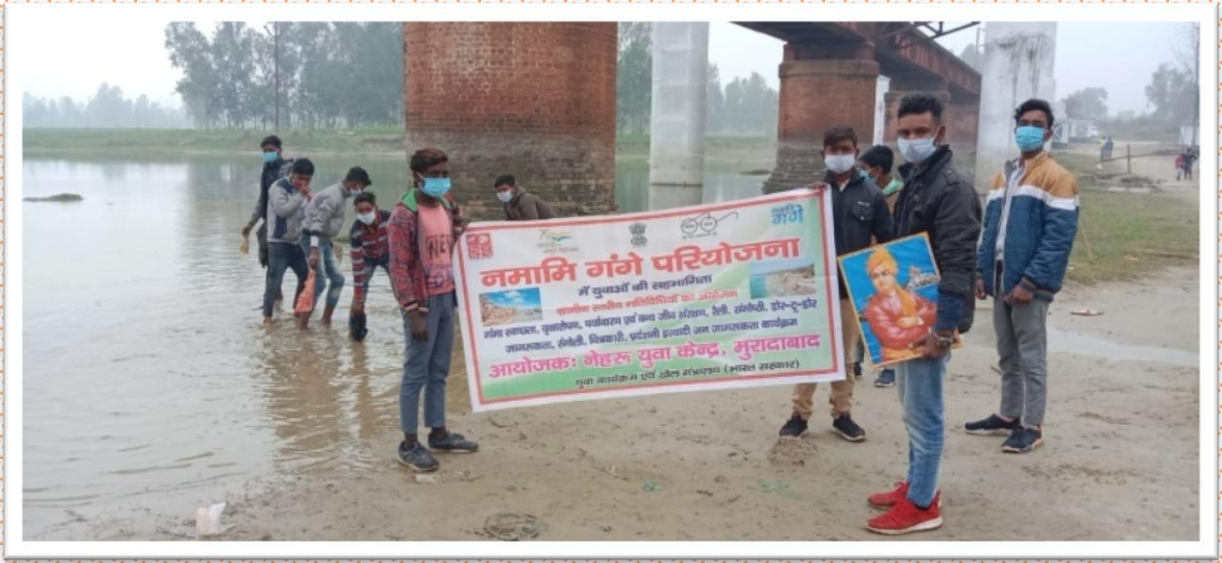
नेहरू युवा केंद्र मुरादाबाद द्वारा स्वच्छता कार्यक्रम,