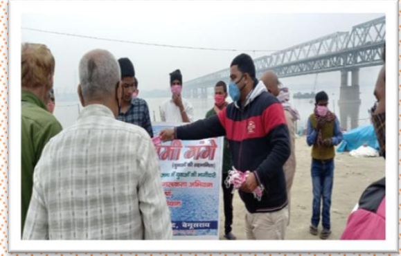
नेहरु युवा केन्द्र, बेगुसराय द्वारा पेम्फलेट वितरित करते हुए गंगादूत