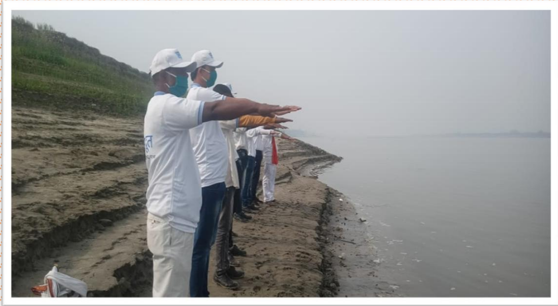
नमामि गंगे पटना के तहत घाट पर शपथ