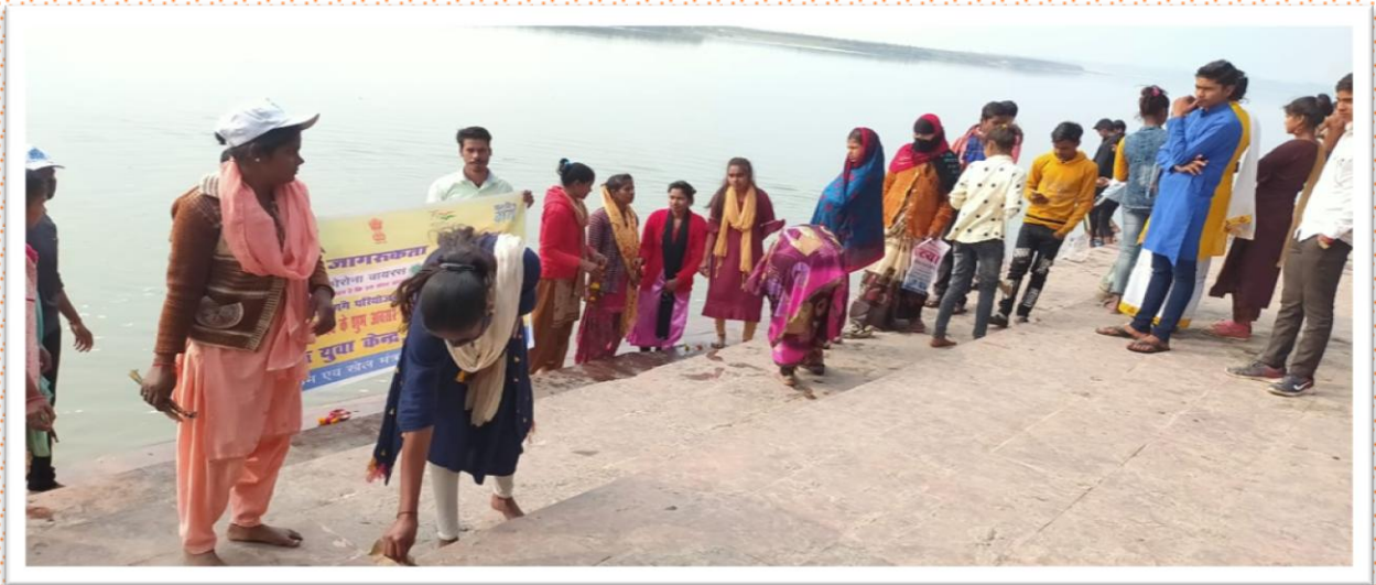
नेहरू युवा केंद्र प्रतापगढ़ द्वारा हौदेश्वरनाथ गंगा घाट पर श्रमदान स्वच्छता अभियान