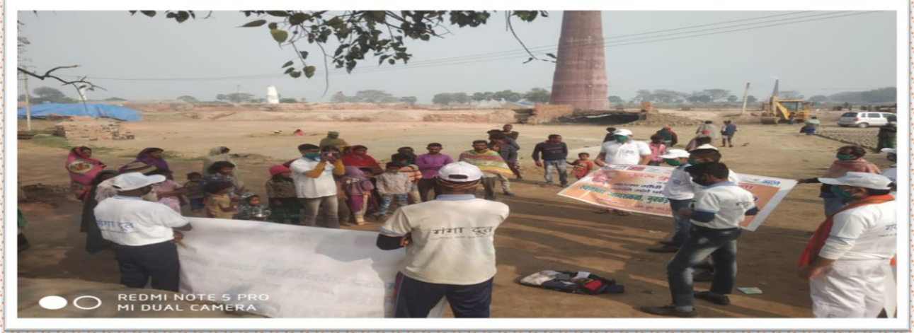
एन वाई के, पटना द्वारा नमामिगंगे के तहत नुक्कड़ नाटक ,