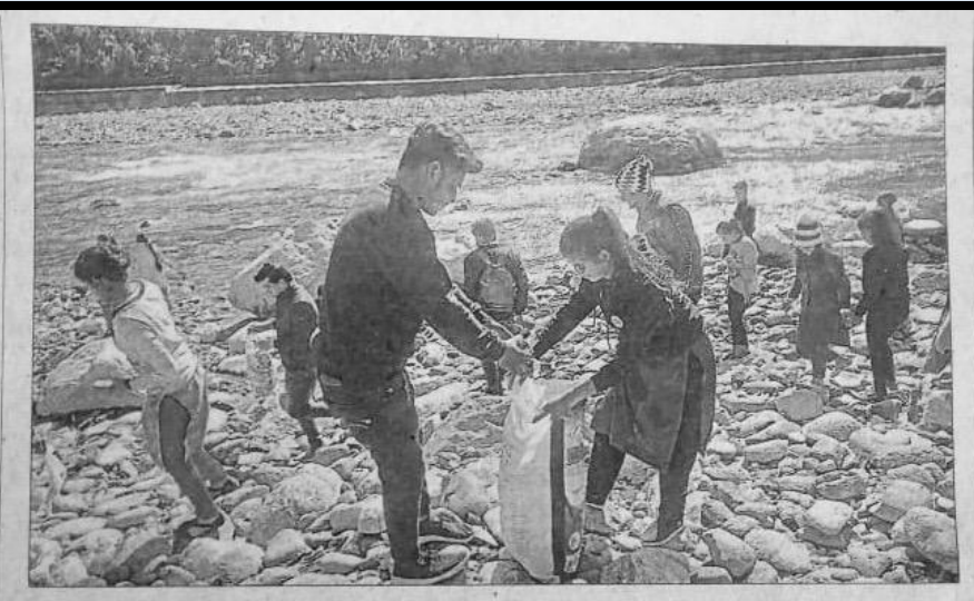
केदार घाट पर गुरुवार को सफाई अभियान चलाते नेहरू युवा केंद्र के सदस्य। • हिन्दुस्तान